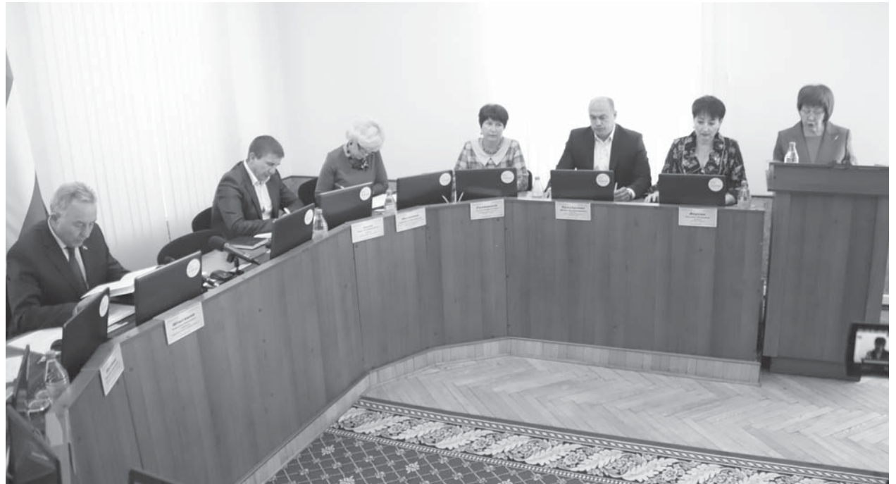
На повестке дня Президиума Верховного Совета Республики Хакасия стояли острые социальные, политические и экономические вопросы

Владимир Штыгашев, председатель Верховного Совета Республики Хакасия