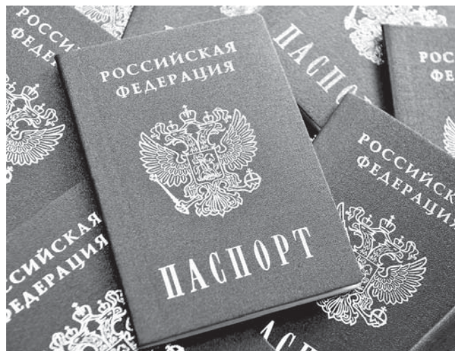
График работы миграционной службы:

Заявление о выдаче документа гражданину РФ по достижении четырнадцатилетнего возраста должно быть подано в течение тридцати суток со дня рождения заявителя в многофункциональный центр по адресу: Шира, ул. Курортная, 12Г. Если человек обратился за паспортом через несколько