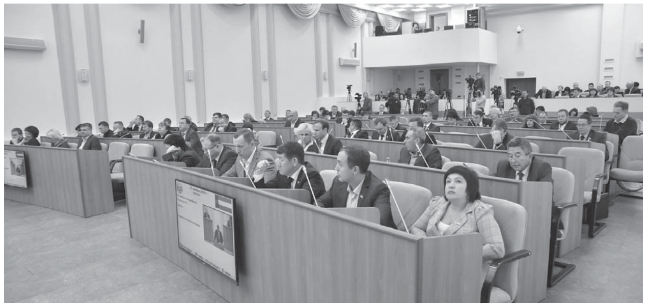
■ На тринадцатой сессии Верховного Совета Республики Хакасия парламентарии рассмотрели в первом чтении проекты законов о республиканском бюджете, малом и среднем предпринимательстве и другие вопросы социально-экономического развития республики

К диалогу были приглашены руководители министерств финансов, экономического развития республики,