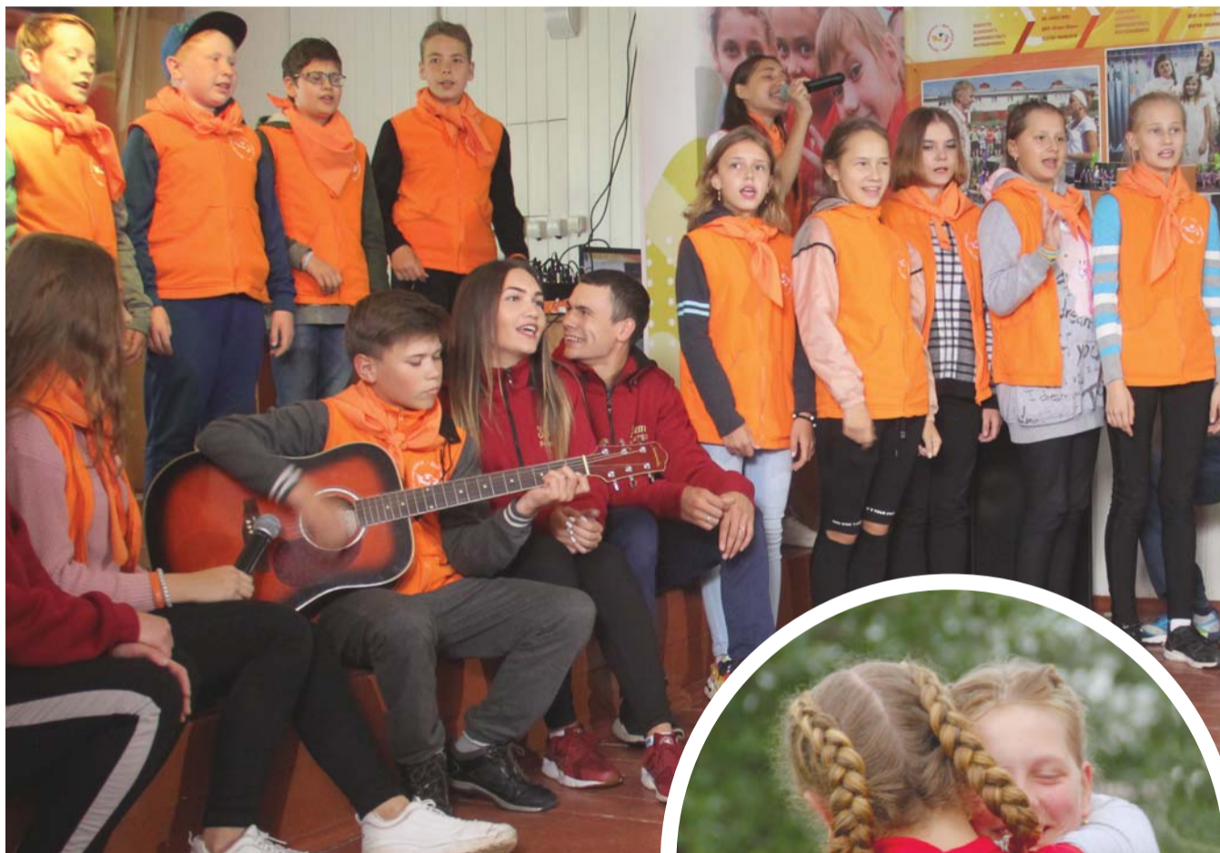
Ребята со своими вожатыми пели прощальные песни под гитару

В субботу в летнем оздоровительном лагере «Озеро Шира» на базе Ачинского НПЗ 135 детей из разных уголков страны прощались друг с другом и своими вожатыми. Завершил свое действие пилотный социальный проект крупнейшей в мире компании-производителя нефти – корпоративный сезон «Вектор Роснефти».