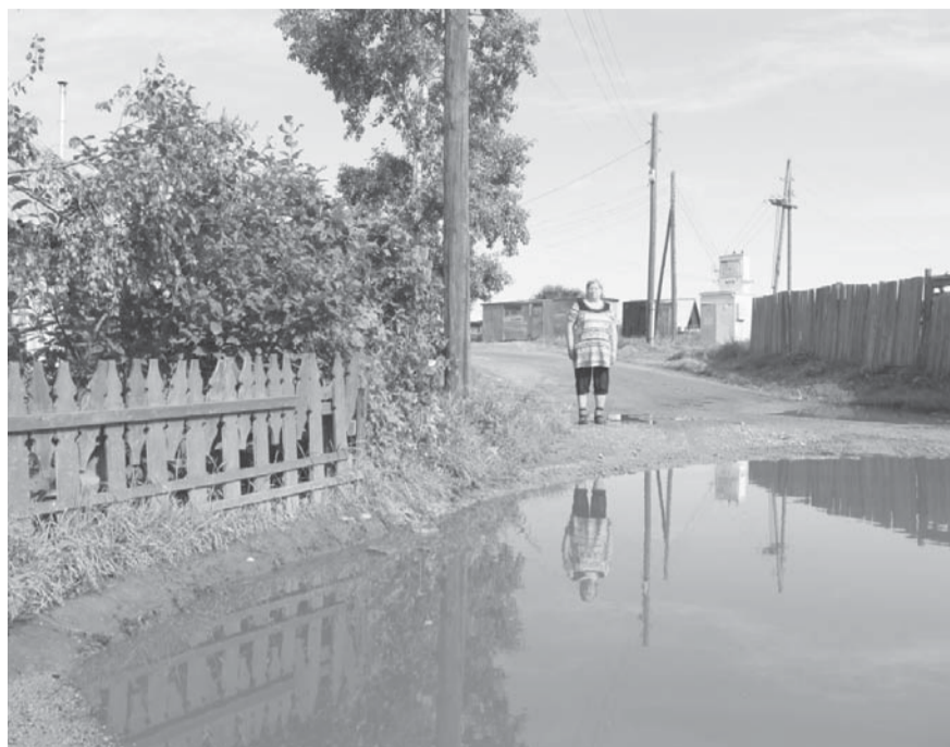
■ Небольшое озеро образовалось на улице Заречная из-за бездействия сельской власти

Специалисты сельского Совета с очевидной проблемой согласились, и