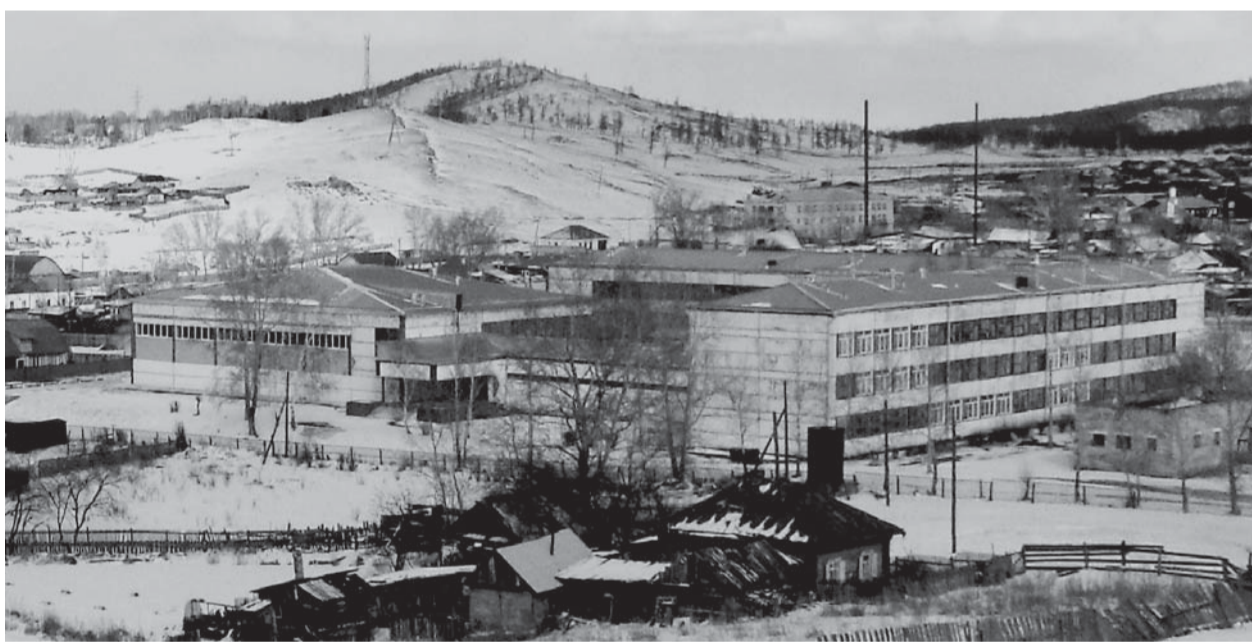
■ Туимская средняя школа № 3 (март 2018)

В восьмидесятых годах прошлого века Туим переживал второе рождение. Первым этапом было строительство рудника «Киялы-Узень» и всей поселковой инфраструктуры в начале пятидесятых. А